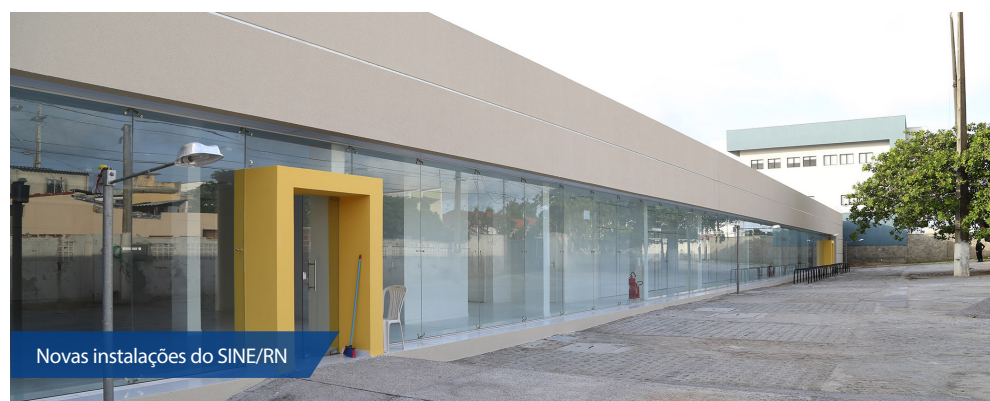
Novas instalações do SINE/RN

“A ideia é de que o sistema passe a ter uma denominação como Cidade do Emprego ou Central do Emprego do Rio Grande do Norte. Isso está sendo estudado, mas nesse momento estamos ava-