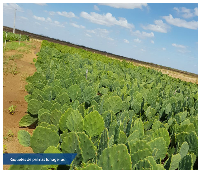
Raquetes de palmas forrageiras

A distribuição será iniciada pelos municípios de Mossoró e Assú. Posteriormente serão contempladas as regionais de Pau dos Ferros, Caicó, Currais Novos, Santa Cruz, João Câmara, São José de Mipibú e São Paulo do Potengi. Em uma segunda etapa, outras 1,3 milhão de mudas serão distribuídas assim que o processo licitatório for finalizado, o que deve ocorrer em breve.