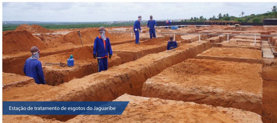
Estação de tratamento de esgotos do Jaguaribe

Em razão das obras de esgotamento sanitário que estão sendo